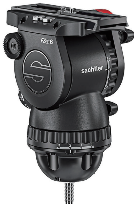
FSB 6 MkII (S2065-0001)