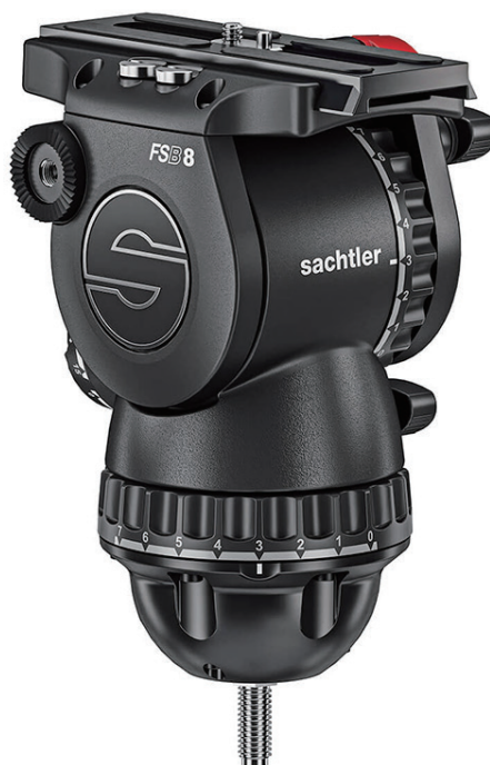
FSB 8 MkII (S2069-0001)