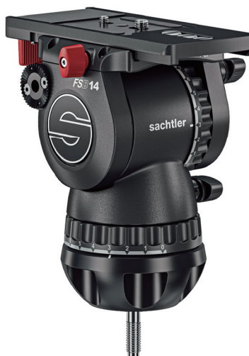
FSB 14T MkII