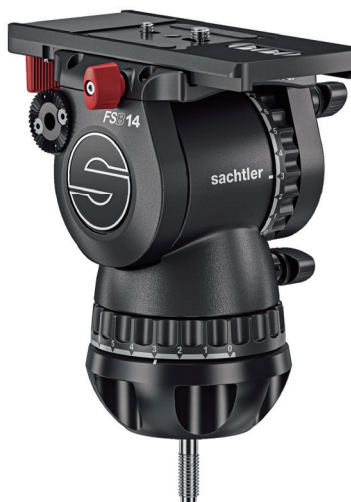
FSB 14T MkII