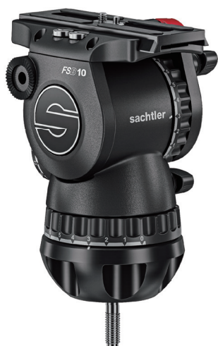
FSB 10 MkII