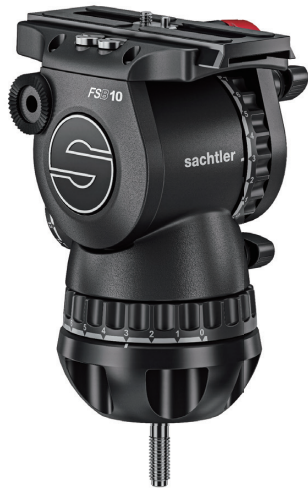
FSB 10 Mk II (S2073-0001)