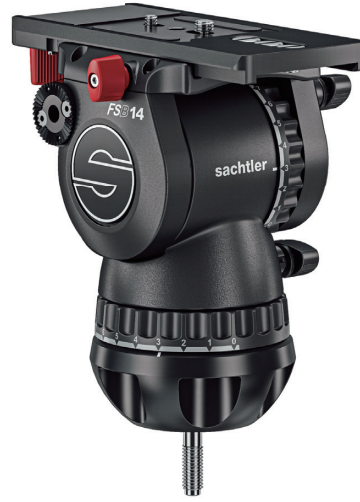
FSB 14T Mk II (S2077-0002)